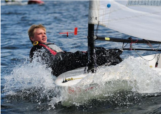
Foto-sejler-event (kan evt. laves ved en NoNonsens lejr). En fotograf kommer ud og fotograferer sejlerne i deres bedste sejlerøjeblik i fuld action sideløbende med en kapsejlad for sjov. Hver sejler får et farveprint i A4 med hjem som gave. Sejlerne kan yderligere købe det digitale foto.